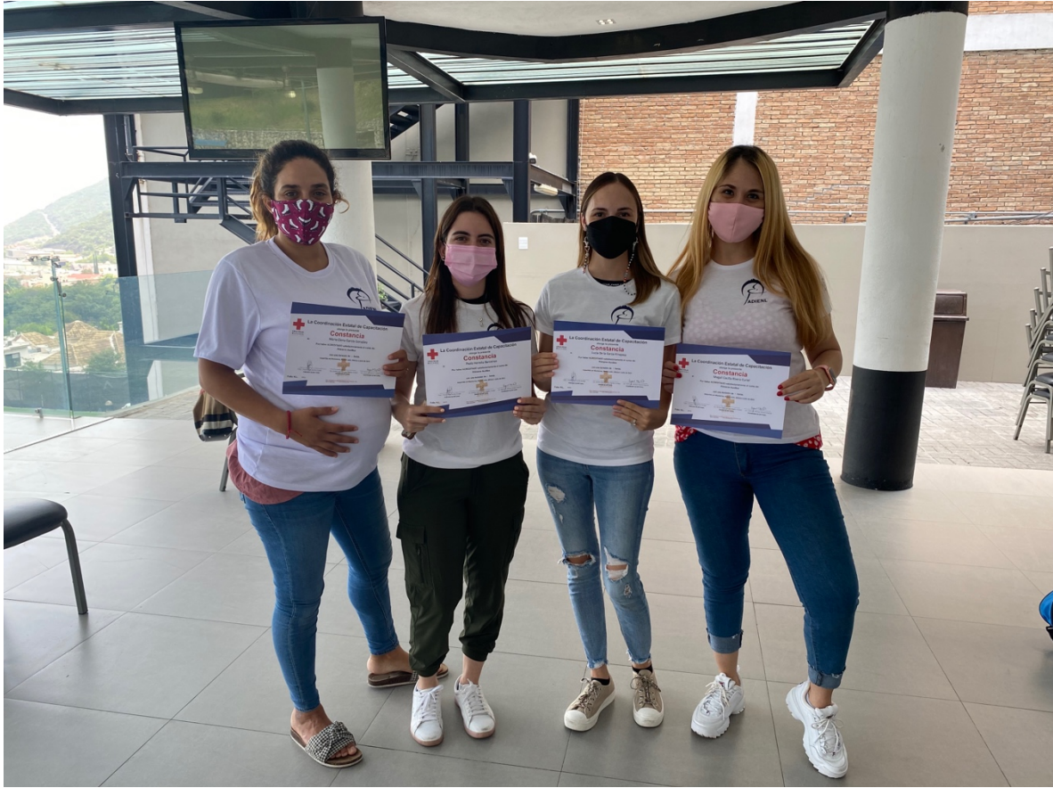
PARTICIPANTES DE LA PISTA FUNDIDORA