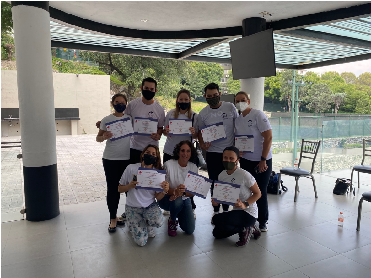
PARTICIPANTES DEL ICE COMPLEX