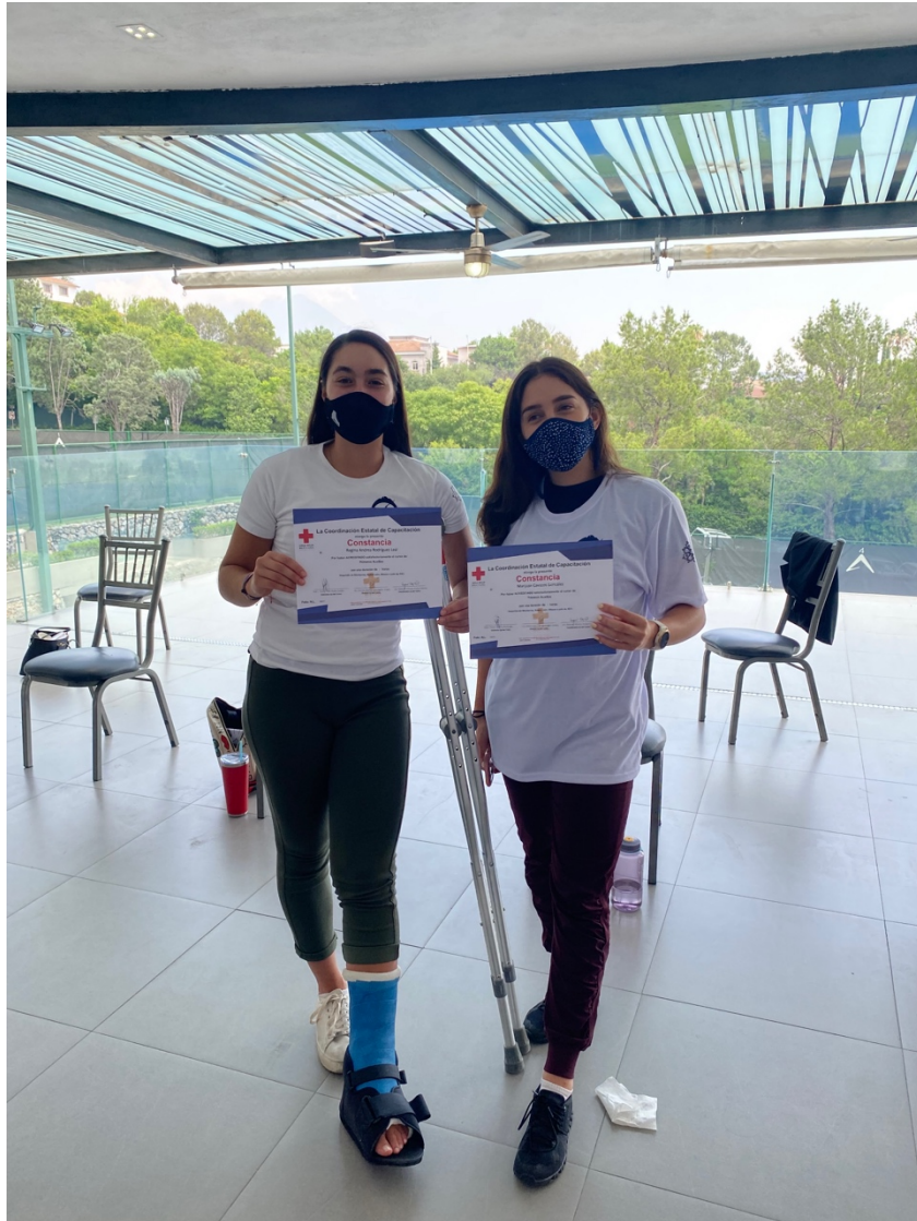
PARTICIPANTES DEL DEPORTIVO SAN AGUSTIN